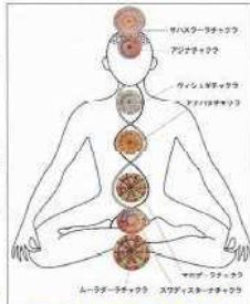
7つのチャクラの位置と名称

微細身は、粗大身の死後も存続し、肉体を高い次元から支配する霊体のような存在です。生命エネルギー(プラナ)の通り道である「ナーディー」とその通り道の結合点である7つの「チャクラ」がここに存在します。